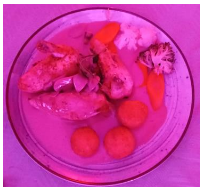
Trio de poulet