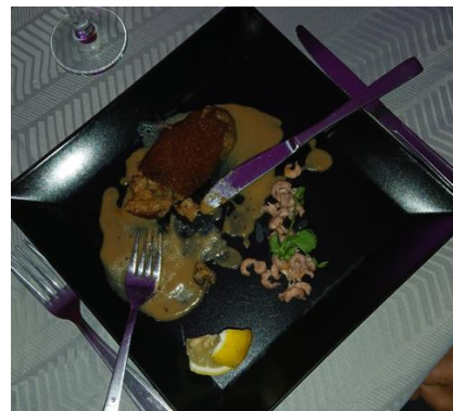
ou Croquette de fromage